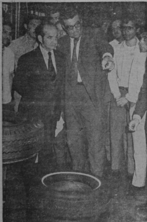
El Presidente Figueres escucha explicaciones del proceso de fabricación de llantas en la fábrica FIRESTONE, que ayer visitó en la tarde. El señor Figueres hizo un recorrido de dos horas por todas las instalaciones de la compañía.